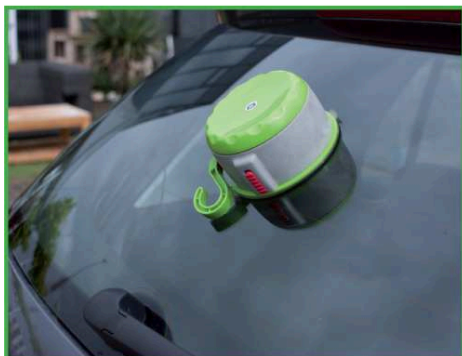
4. Le Twist+Go est désormais solidement fixé au véhicule.