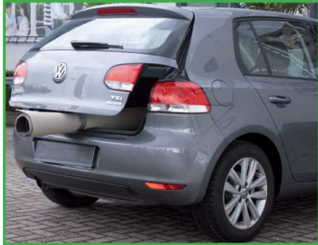
1. Affaires encombrantes dans le coffre? Twist+Go est la solution.