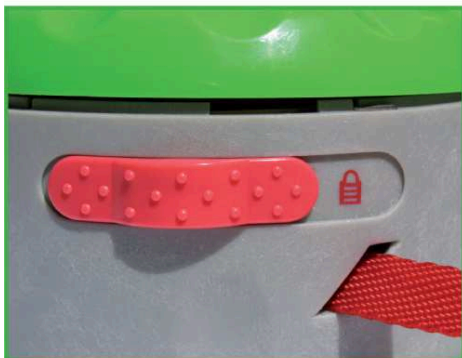
10. Desserrage: tourner la partie verte du Twist+Go légèrement sur la droite et déplacer le bouton rouge, en même temps, sur la gauche. La sangle rouge s'enroule automatiquement.