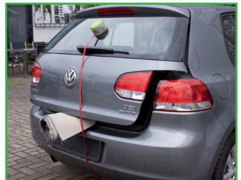
9. La sangle rouge est en place, elle maintient le coffre et l'empêche de s'ouvrir.