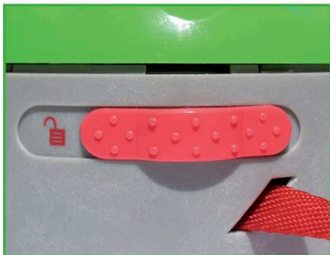
7. Faire glisser le bouton rouge vers la droite.