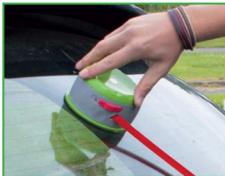
8. Tourner la partie verte du Twist+Go dans le sens des aiguilles jusqu'à ce que la sangle rouge soit assez serrée.