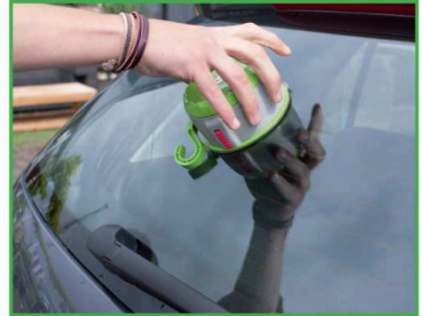
3. Tourner la partie grise vers le droite jusqu'au verrouillage du Twist+Go.