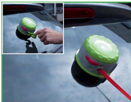
5. Tirer le crochet vert et dérouler la sangle rouge.