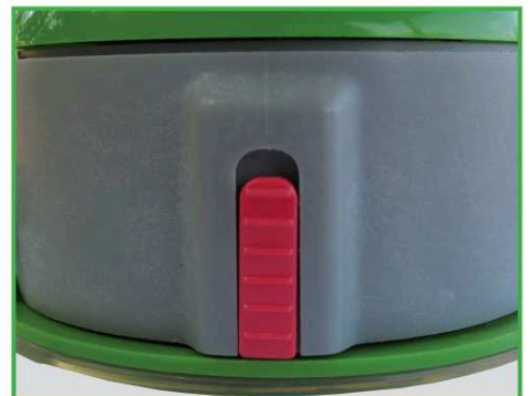
12. Rangement: pousser le curseur rouge vers le haut et tourner la partie grise à gauche.