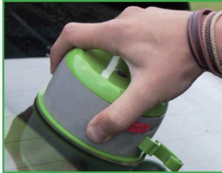
2. Apposer le Twist+Go sur le pare-brise arrière en collant la ventouse qui se trouve sous le Twist+Go.