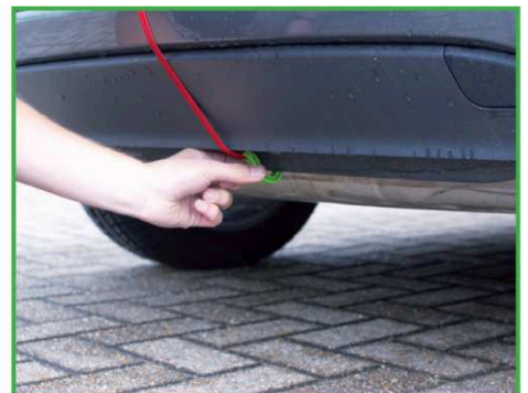
6. Attacher le crochet à un point fixe du véhicule sous le pare-chocs tel que l'anneau de remorquage ou le bas du pare-chocs.